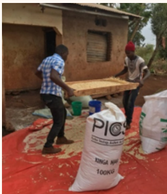
Njia zisizo faa na njia zilizobora za kupepeta